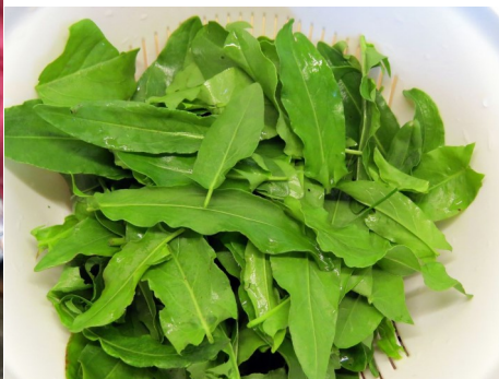
Des feuilles d'oseille