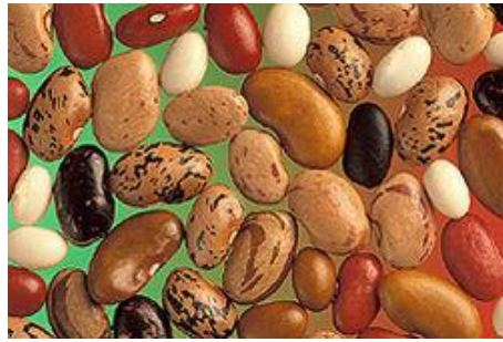
haricots blancs, rouges...