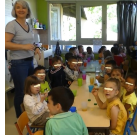
Les petits déjeuners à la maternelle

Dans le cadre de la Semaine de l'Economie Sociale et Solidaire, avec le Centre Socio Culturel (CSC) et l'épicerie solidaire, le collège a organisé une collecte solidaire au profit de l'épicerie solidaire. Les élèves du Conseil de Vie Collégienne (CVC) ont par la suite prêté main forte à l'équipe de bénévoles de l'épicerie solidaire pour gérer l'inventaire et le rangement des produits collectés au collège.