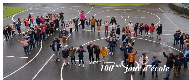
100 ème jour d'école