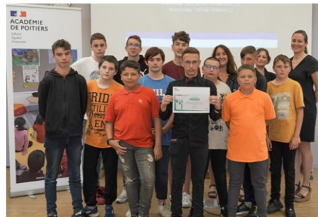
Remise du prix au rectorat de Poitiers