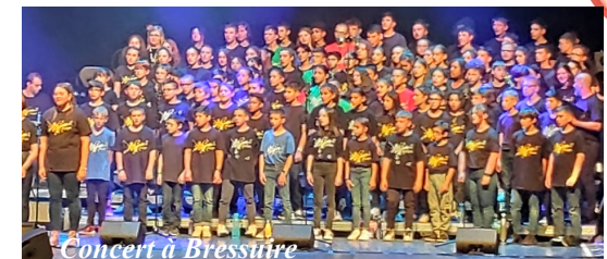
Concert à Bressuire